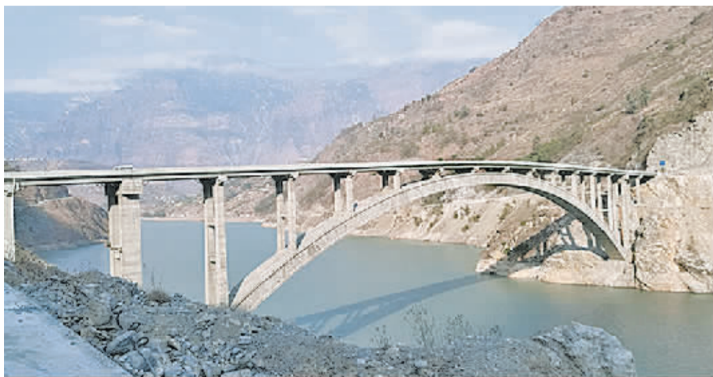
金阳县对坪溜索改桥工程。

近日,州公路工程质量监督分站抽调精干力量,对金阳县对坪、布拖县冯家坪两处溜索改桥项目进行交工质量实体检测。