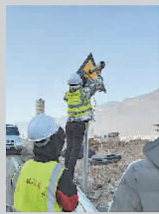
交工验收质量检测。

及交安工程;项目监督组在对外观质量检查及综合核查后,现场与监理和施工单位交换了意见,并提出整改内容,整改工作完善后,第一时间出具交工检测意见,督促项目及时提交验收。