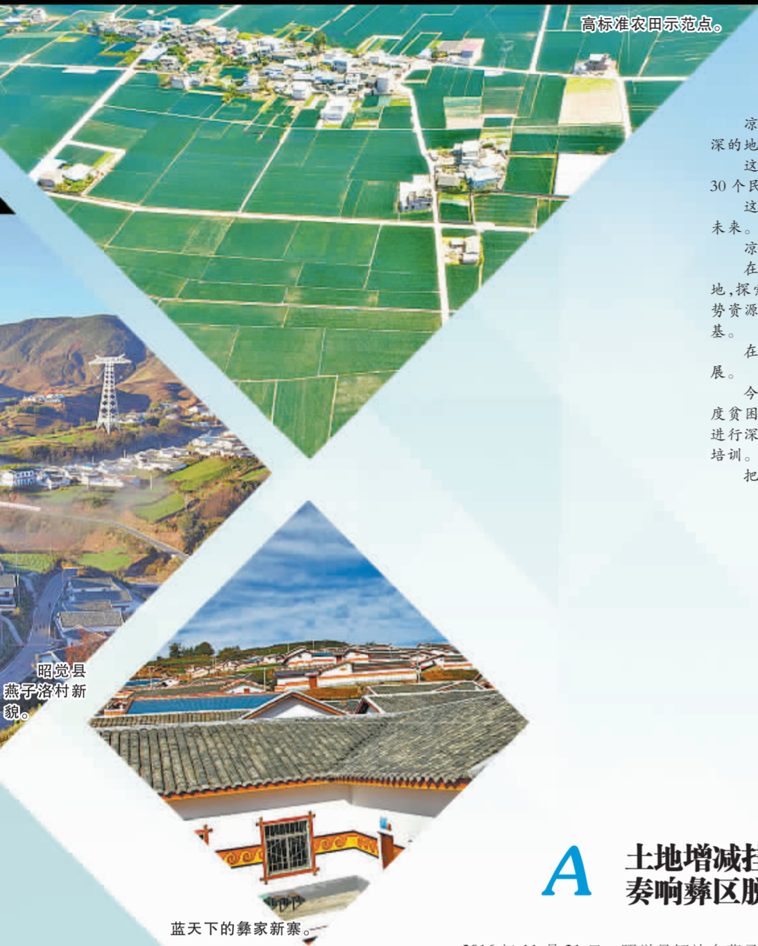
高标准农田示范点。