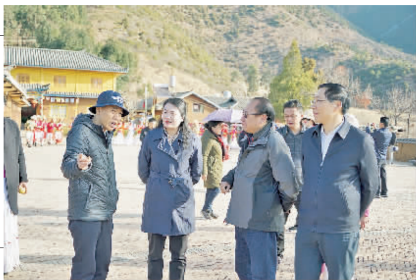
泸沽湖管理局负责人介绍景区创5A进展情况。