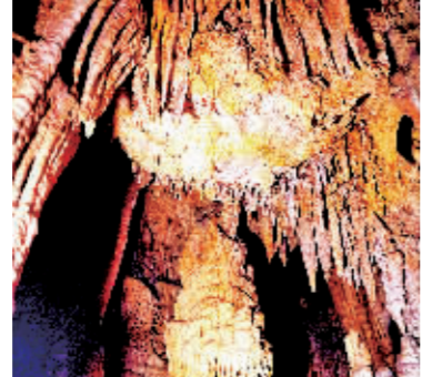
“乌依瓦布”地下溶洞。

溶洞的位置在一处大山的悬崖下面,一般人很难发现。洞口直径不过一米,往里望去感觉深不见底,两冬暖夏凉。