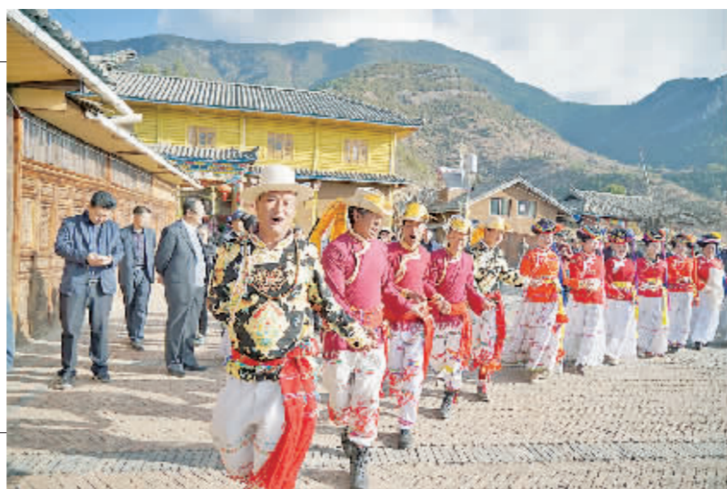
当地村民积极融入到旅游产业中,为游客表演摩梭甲搓舞。