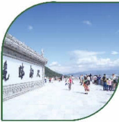
泸山观景平台游客众多。