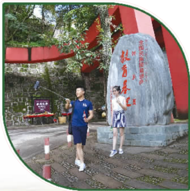
奴隶社会博物馆前合影。

黄金周第二天,记者走进螺髻山景区。上午9点,景区游客中心停车场已经停满了川A、渝A、川B等外地车辆。据悉,当天,螺髻山景区共接待游客2000人次,自驾车600余台,自驾游以重庆、成都、云南市场为主。 据悉,今年国庆、中秋假日,自驾游、自助游仍是我州旅游市场的主力军。国庆期间,以家庭式自助、走亲访友为主的自驾游仍然是来凉山旅游的主要方式,景区自驾游游客占整个游客量的比重越来越大。 节日期间,邛海泸山、螺髻山、泸沽湖、会理古城、越西文昌故里、安哈彝寨仙人洞、冕宁灵山等景区成为了自驾游的热门景区,各景区停车场基本饱和,挂外地牌照的小型车辆占八成以上。 据悉,8天长假,我州共接待自驾游21.43万辆,再创历史新高。自驾游的持续增加,缘于近年来交通基础设施建设的提升,通过交通大会战,西昌到各县市和重点景区的道路通畅性有了很大程度的提高,交通的连接,也将各景区更好的串联起来,形成旅行环线。“交通路网的通达,使得个性化更强、自由度更高的自驾游成为出游的主力军。加上这个十一长假继续实行7座以下小型客车高速免费通行政策,意料之中的旅游高潮如约而至。”旅游业业内人士分析说。 而旅游产品的不断丰富,也为游客出游提供了更多的选择。目前,全州有国家级旅游度假区1个、省级旅游度假区2个,国家级生态旅游示范区1个,省级生态旅游示范区2个,A级景区19个,其中4A级旅游景区7个,3A级旅游景区9个。