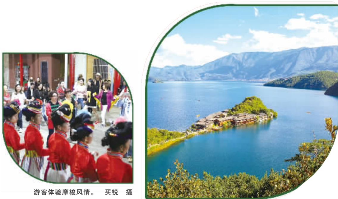
游客体验摩梭风情。