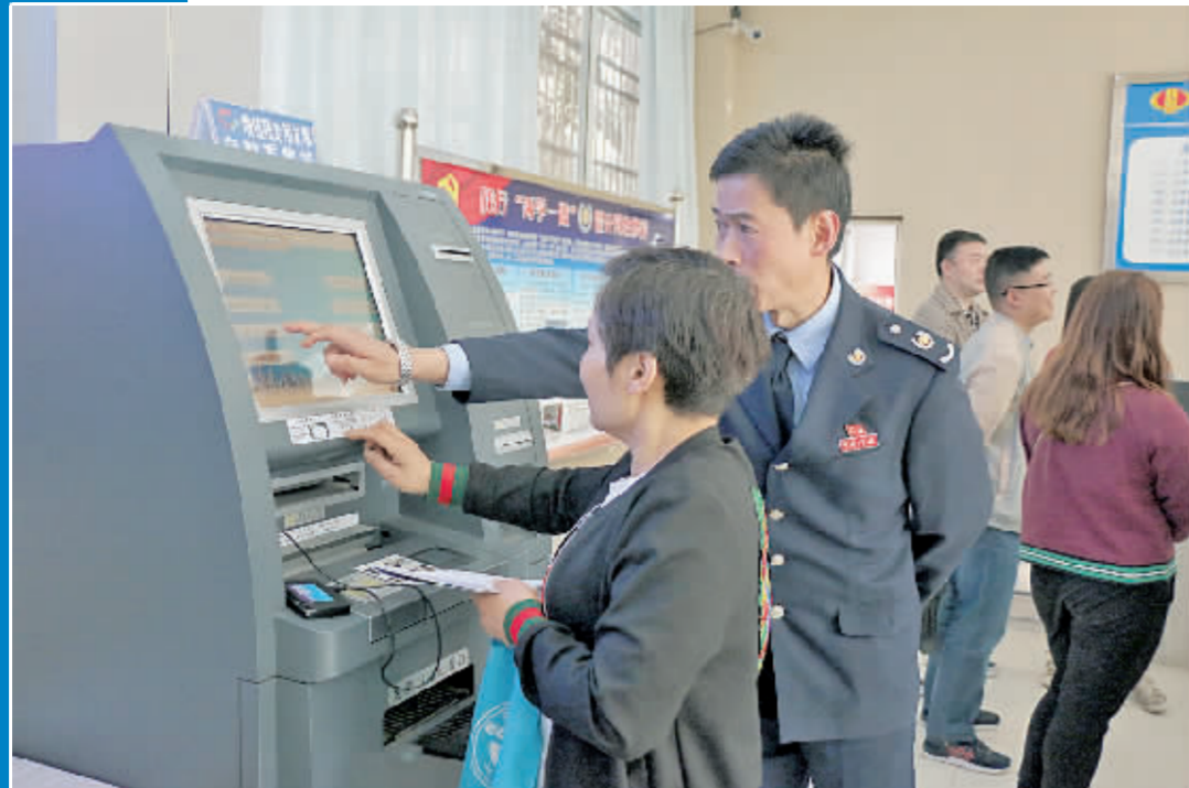
群众来国税局办理业务,省时又省心。