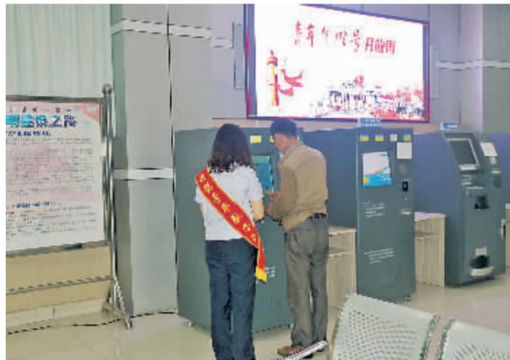
现代化的办理手段,又快又好。